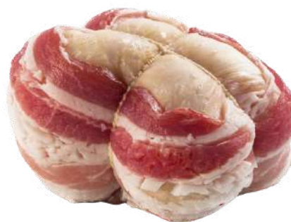
ROLLATINE DI POLLO

PESO UNITÀ CONFEZIONE PESO TOT 3 G 1 PEZZI 3 KG