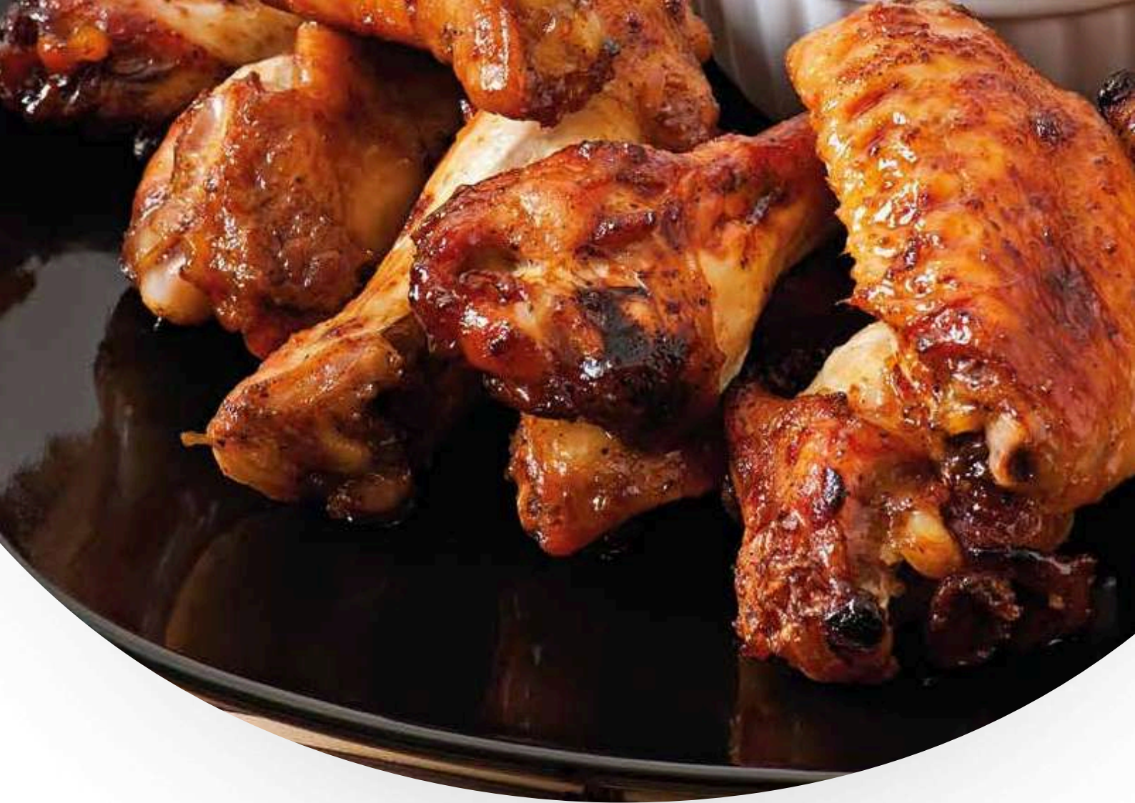
DURANGO ALETTE DI POLLO