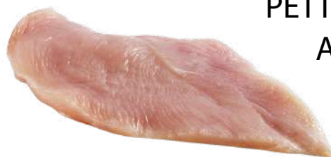
PETTO DI POLLO A FETTE(120)

PESO UNITÀ CONFEZIONE PESO TOT 6 G 1 PEZZI 6 KG