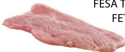
FESA TACCHINO FETTE(120G)

PESO UNITÀ CONFEZIONE PESO TOT 6 KG 1 PEZZI 6 KG