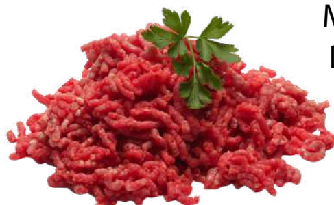
MACINATO DI BOVINO

PESO UNITÀ CONFEZIONE PESO TOT 5 KG 1 PEZZI 5 KG