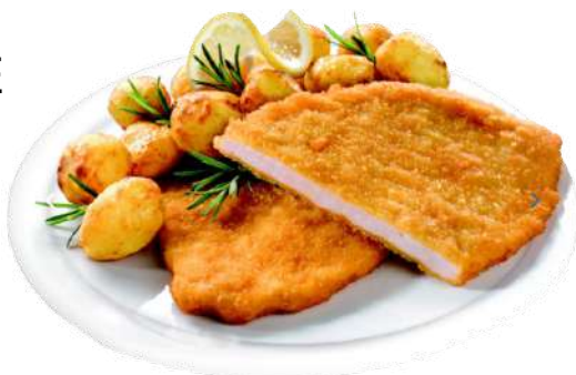
MILANESE DI POLLO

CODICE ARTICOLO 005288 CODICE EAN 98015709919978