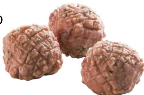
POLPETTE DI BOVINO

PESO UNITÀ CONFEZIONE PESO TOT 200G 15 PEZZO 3 KG