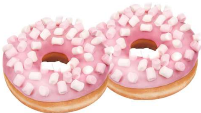
CIAMBELLA FRUTTI DI BOSCO