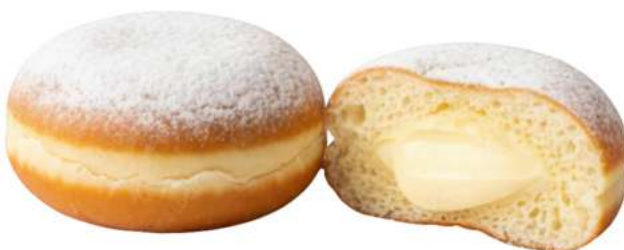
MINI KRAPFEN CREMA

CODICE ARTICOLO 01554 CODICE EAN 8020731146039