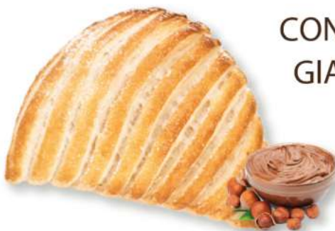
CONCHIGLIA MAXI GIANDUIA & CIOK