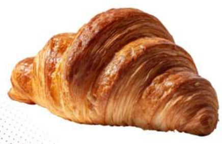
CORNETTO MIGNON DRITTO

CODICE ARTICOLO 005043 CODICE EAN 8032584215275