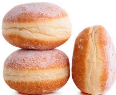
KRAPFEN BURRO CREMA

CODICE ARTICOLO 02293 CODICE EAN 8020731002045