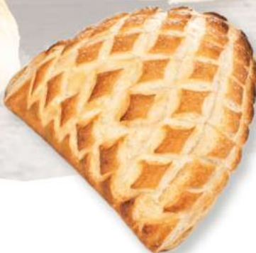
CONCHIGLIA MAXI PANNA & LATTE