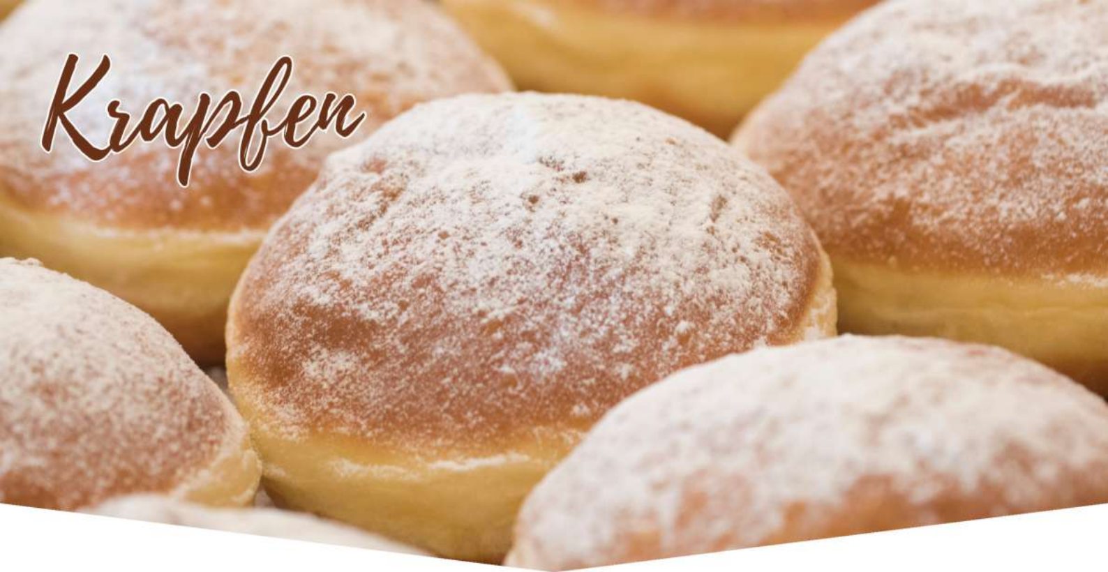
KRAPFEN BURRO VUOTO