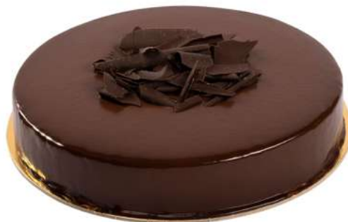
Variazioni Fondenti COD. CA01001 - 1300 g

Soffice biscotto al cacao farcito con 3 diverse varietà di cioccolato.