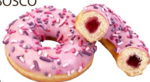
CIAMBELLA DONUTS CIOK