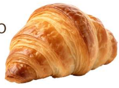
CORNETTO MIGNON VUOTO

CODICE ARTICOLO 005218 CODICE EAN 8032584210560