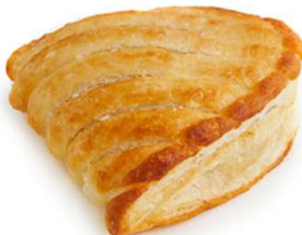
LUNETTA CREMA PASTICCERA & AMARENA